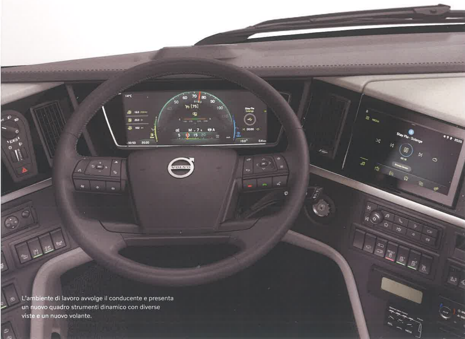
L'ambiente di lavoro avvolge il conducente e presenta un nuovo quadro strumenti dinamico con diverse viste e un nuovo volante.