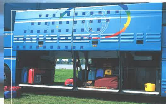
Bagagliaiera passante tra le più ampie della categoria con una capacità di ben 11 m 3 .