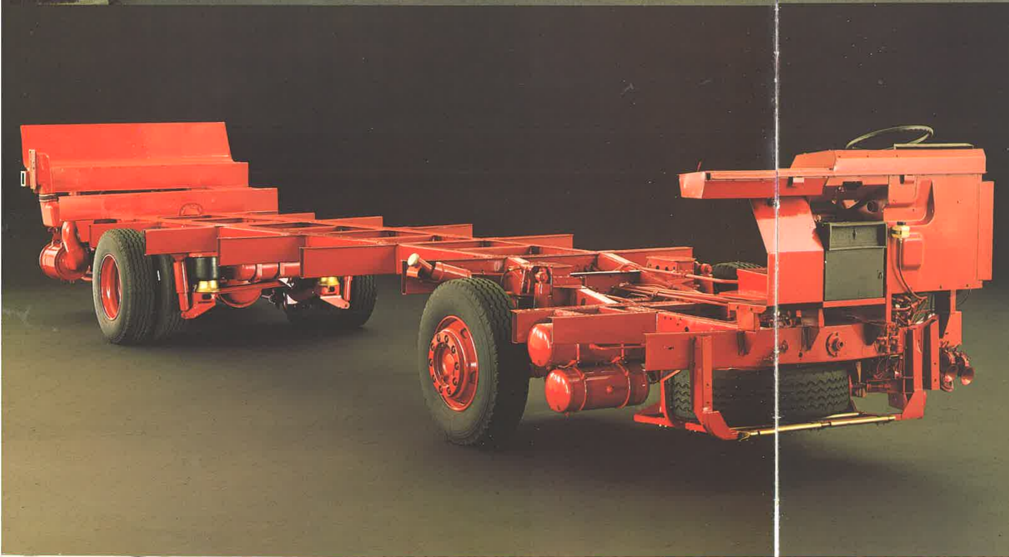
Autobus «Spazio» realizzato dalla Carrozzeria Renzo Orlandi su autotelaio Fiat 370