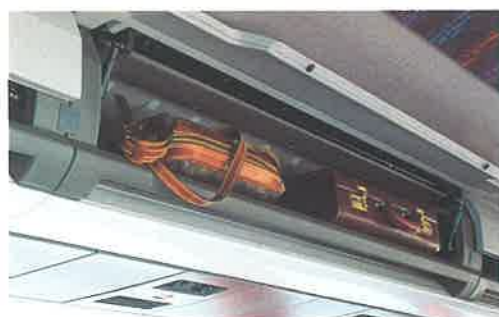
Vani per bagagli a mano con sportelli di chiusura. Bocchette individuali di climatizzazione, luci di cortesia e tasto chiamata hostess.

I rivestimenti interni sono in materiale sintetico morbido al tatto, fonoassorbente e facilmente pulibile.