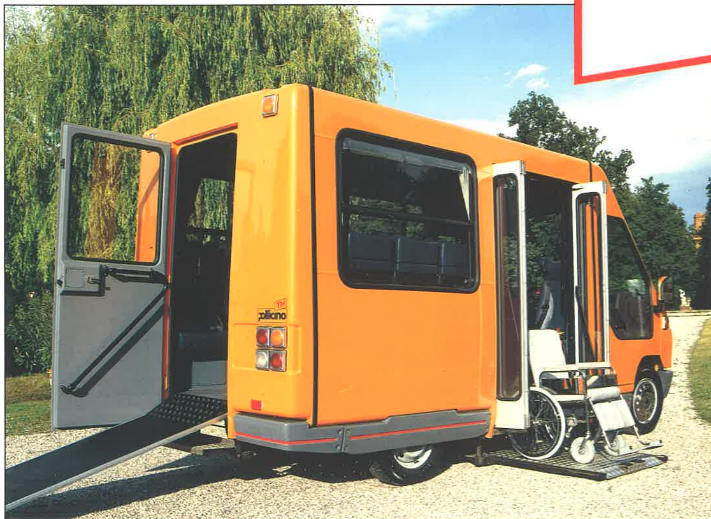
Pollicino TH 11, in "versione finanziabile"