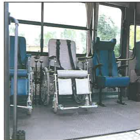
Alloggiamento due carrozzelle più variante posto passeggero (TH 12).