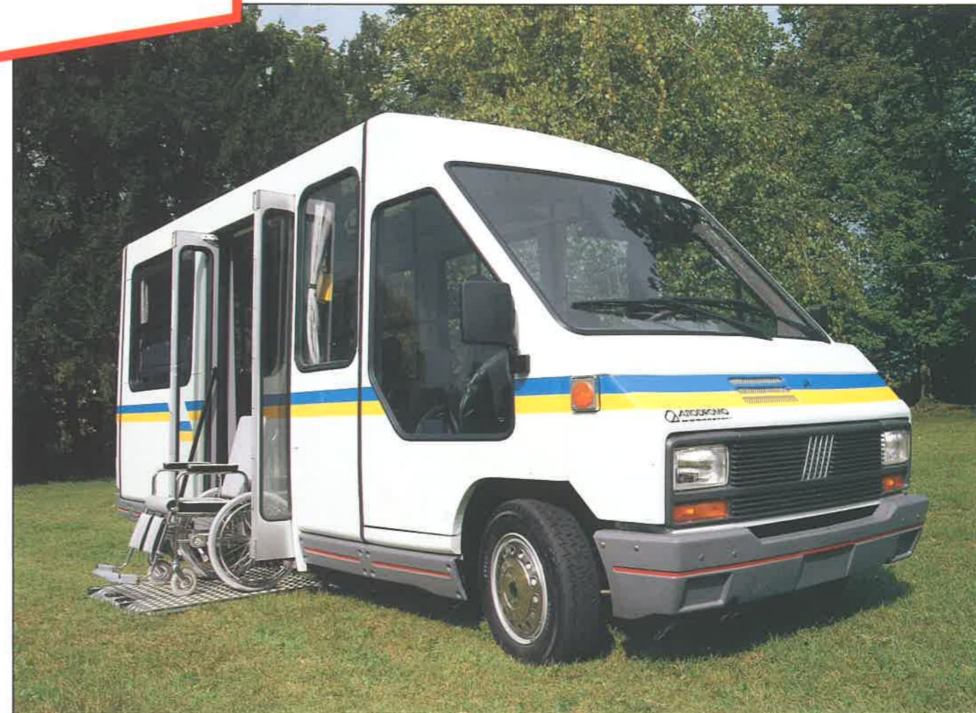
Pollicino TH 12, in "versione privata"