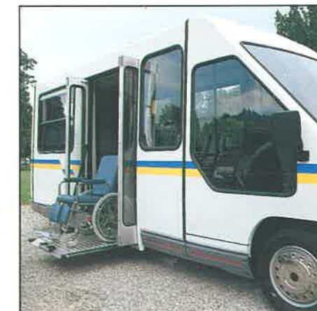
Porta laterale "a libro" con elevatore automatico per carrozzelle

È il risultato di un processo di innovazione. Le versioni TH 11 e 12 (per il trasporto di due o tre carrozzelle oltre a 8 posti-passeggero), per uso "pubblico" o "privato", accolgono pienamente le nuove disposizioni di legge italiane ed europee. Grazie al contributo di importanti istituti di ricerca specializzata e a quello degli stessi enti clienti, Autodromo Car Innovation di Modena ha potuto realizzare un nuovo traguardo, frutto di importanti ed esclusive collaborazioni, per un obiettivo giusto: "più mobilità per tutti".