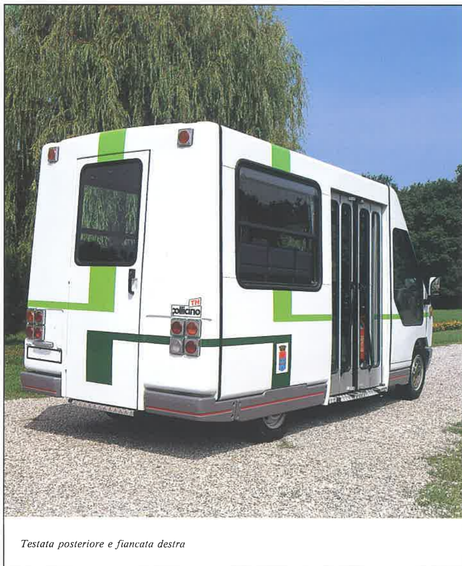
Testata posteriore e fiancata destra