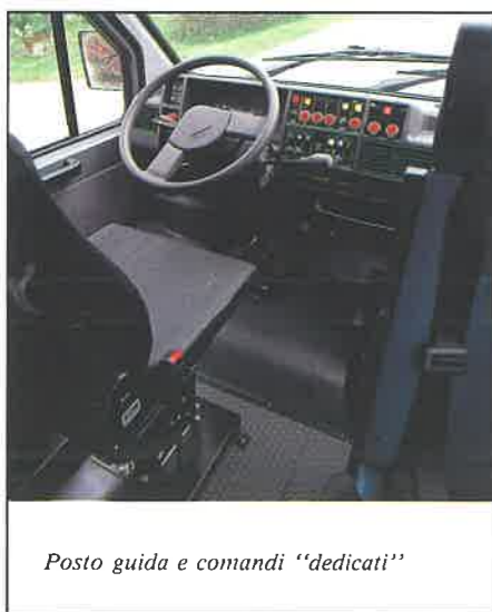
Posto guida e comandi "dedicati"

L'economicità di esercizio; con POLLICINO tutto è più semplice, anzi "normale", perchè non richiede officine appositamente attrezzate — ma una comunissima assistenza automobilistica —, contiene al minimo fermi-macchina e