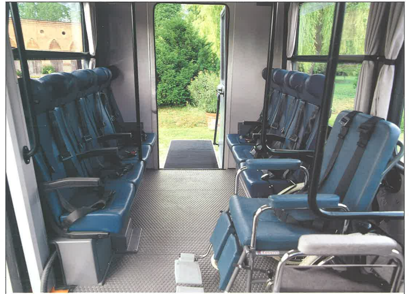
Interno, veduta dall'ingresso laterale anteriore

riore aurti icata edili erno ante uota ento riore