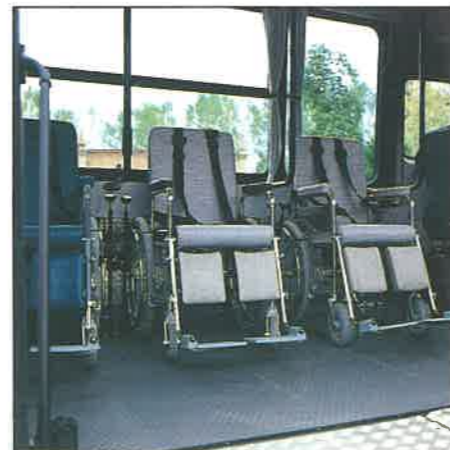
Alloggiamento tre carrozzelle (TH 12).

manutenzione e, in più, c'è sempre, al vostro fianco, il servizio assistenza di Autodromo Car Innovation, da Modena in tutta Italia.