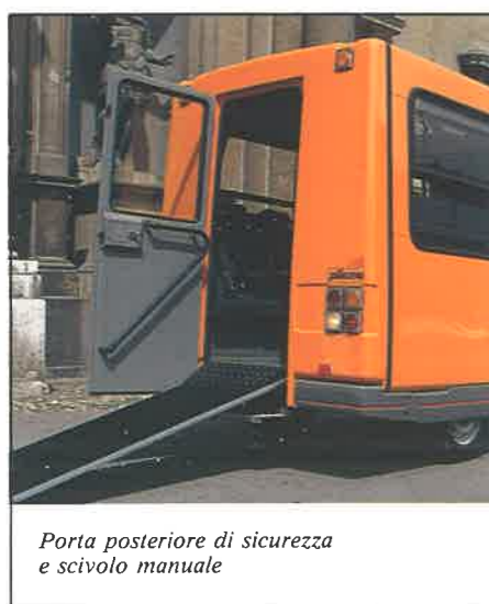
Porta posteriore di sicurezza e scivolo manuale

Il progetto POLLICINO rappresenta una rilevante evoluzione dei metodi e degli strumenti finalizzati al trasporto collettivo. POLLICINO è prodotto, dall'aprile 1987, in più versioni: urbano, interurbano, privato, da 20 a 35 posti, TH 11 e 12 con motorizzazione diesel e, a richiesta, a "benzina verde" con marmitta catalitica. I diversi allestimenti di carrozzeria sono funzionali a risolvere le sempre più articolate esigenze di mobilità: nelle città, nelle località e nei quartieri decentrati, nei centri storici e antichi, nei collegamenti rapidi per le nuove aree industriali e di servizio. Dall'inizio, il progetto POLLICINO ha previsto una specifica destinazione per il trasporto "persone a ridotta capacità motoria" che, nell'insieme e sotto i più complessi punti di vista materiali, rappresentano un grande impegno sociale.