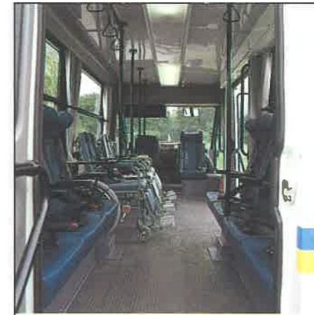
Interno, veduta della porta di sicurezza posteriore