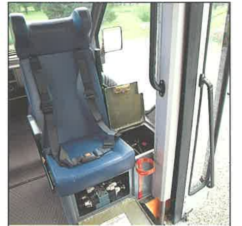
Particolare accessibilità e manutenzione elevatore automatico