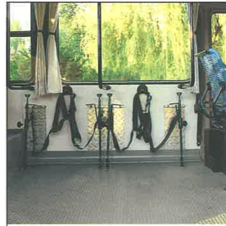
Alloggiamento "dedicato" con sistemi di sicurezza passeggeri disabili e carrozzelle (TH 11).