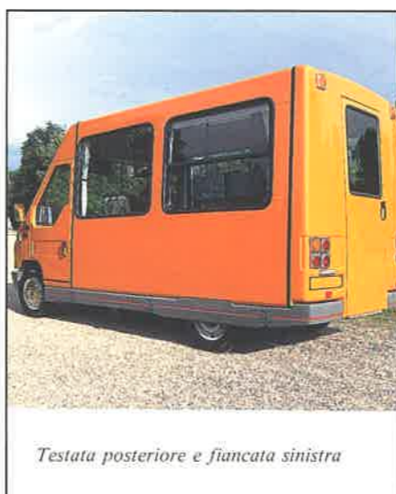
Testata posteriore e fiancata sinistra

La strumentazione "dedicata"; pedana con elevatore mobile per le carrozzelle (comandabile dall'autista, dal personale di servizio oppure dallo stesso disabile), scivolo manuale posteriore con porta di sicurezza, ancoraggi delle carrozzelle molto efficienti e manovrabili anche dal passeggero, cinture di sicurezza a doppia bretella a prova inerziale e sedili con poggiatesta avvolgenti, sostegni e mancorrenti di serie per una pratica movimentazione interna.