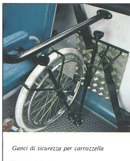
Ganci di sicurezza per carrozzella