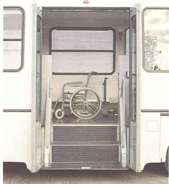
Pedana a gradini