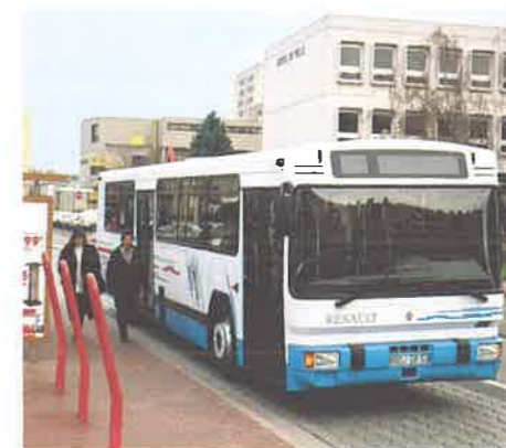
PR 112 / PR 118 ARTICOLATO