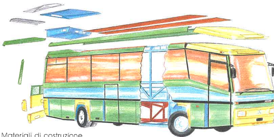
Materiali di costruzione