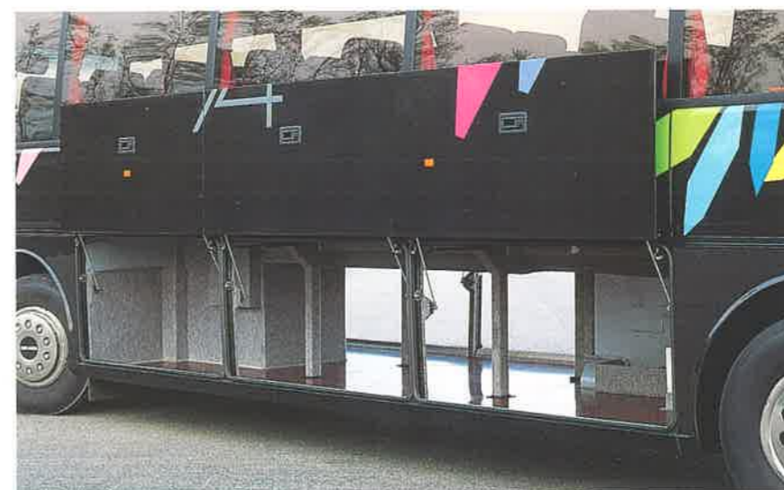
Capace bagagliaia accessibile da entrambi i lati, priva di ingombri, di grande capacità. L'accesso è facilitato da ampi sportelli in lega leggera a traslazione verticale, dotati di chiusura centralizzata.