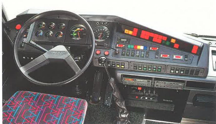
Posto guida con il razionale cruscotto, comandi di regolazione del sedile e le tendine parasole a comando elettrico.

La dotazione di comandi ed indicatori sul cruscotto è completa e di agevole accessibilità. Gli specchi retrovisori sono telecomandati e dotati di sbrinamento elettrico.