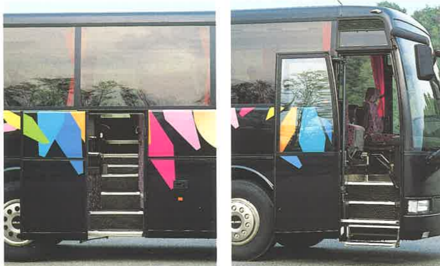
Porte passeggeri, anteriore e centrale, rototraslanti a comando elettropneumatico.