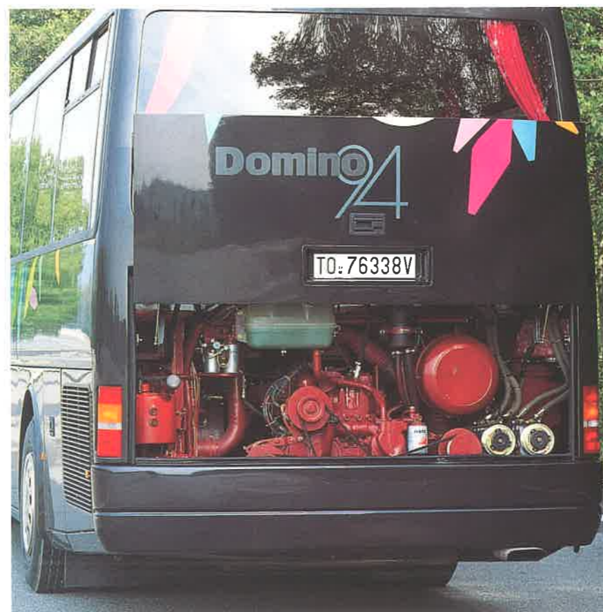
Accessibilità al vano motore con sportello di chiusura di nuovo disegno.

Con Domino il concetto di affidabilità va ben oltre le soluzioni tecniche adottate per ridurre e facilitare la manutenzione. Oltre alla capillare rete europea Iveco, con Domino il Cliente può contare su un servizio di assistenza « Non Stop » operativo 24 ore su 24, 365 giorni l'anno, su tutto il territorio Europeo. Per attivarlo basta una semplice telefonata (Numero verde).