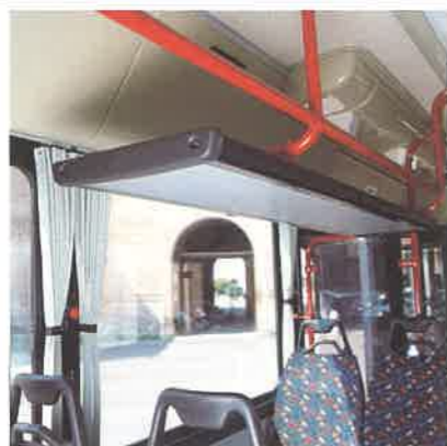
Particolare sedili Particolare cappelliera