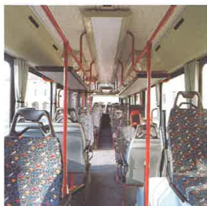
Cockpit Allestimento interno