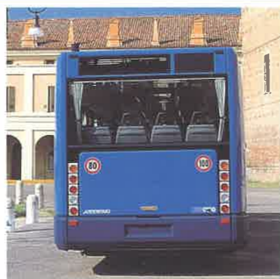
Vano motore Vetratura posteriore