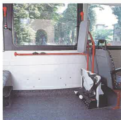
Pedana elettroidraulica Box carrozzella