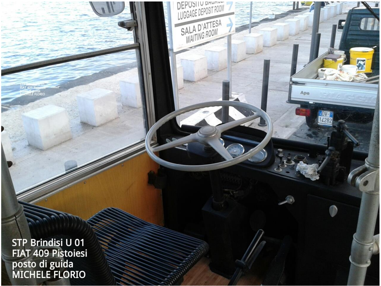
STP Brindisi U 01 FIAT 409 Pistoiesi posto di guida MICHELE FLORIO