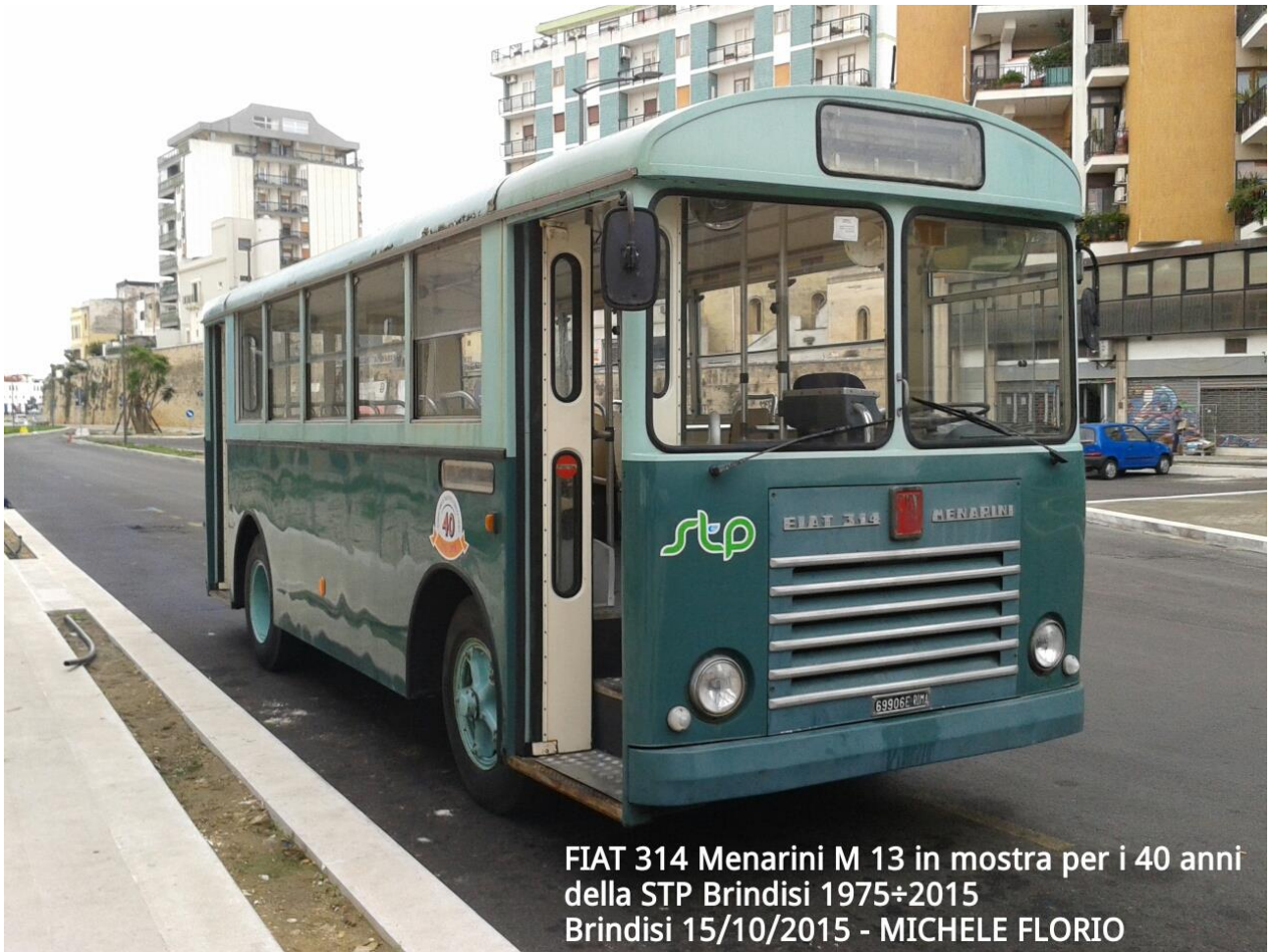
FIAT 314 Menarini M 13 in mostra per i 40 anni della STP Brindisi 1975÷2015 Brindisi 15/10/2015 - MICHELE FLORIO