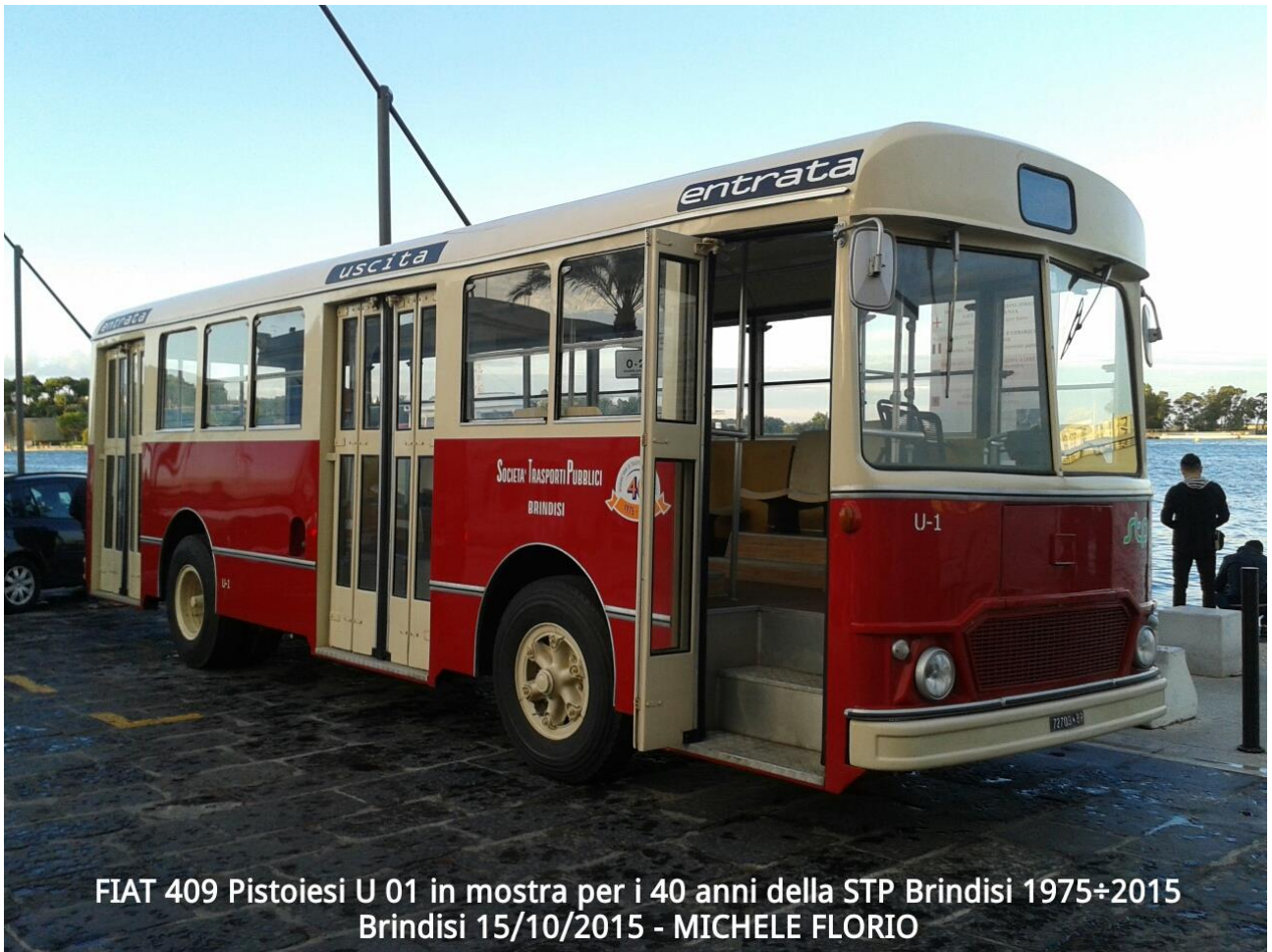
FIAT 409 Pistoiesi U 01 in mostra per i 40 anni della STP Brindisi 1975÷2015 Brindisi 15/10/2015