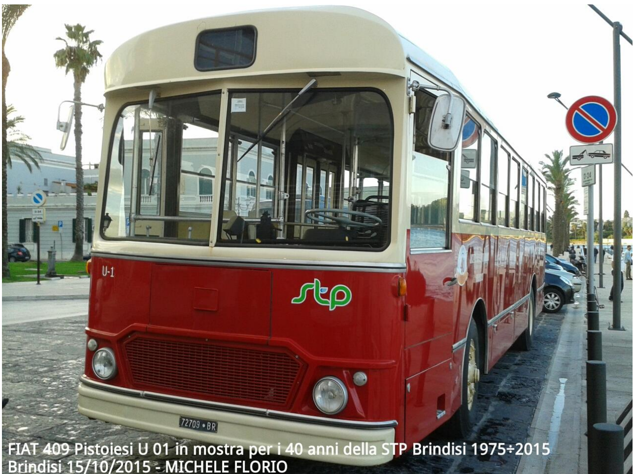
FIAT 409 Pistoiesi U 01 in mostra per i 40 anni della STP Brindisi 1975÷2015 Brindisi 15/10/2015 - MICHELE FLORIO