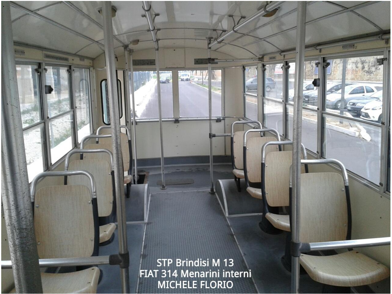
STP Brindisi M 13 FIAT 314 Menarini interni MICHELE FLORIO