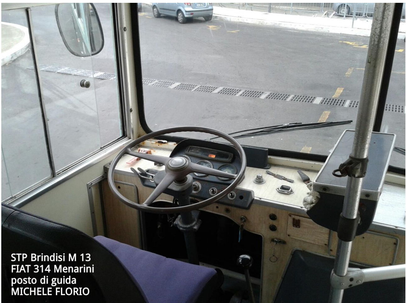
STP Brindisi M 13 FIAT 314 Menarini posto di guida MICHELE FLORIO